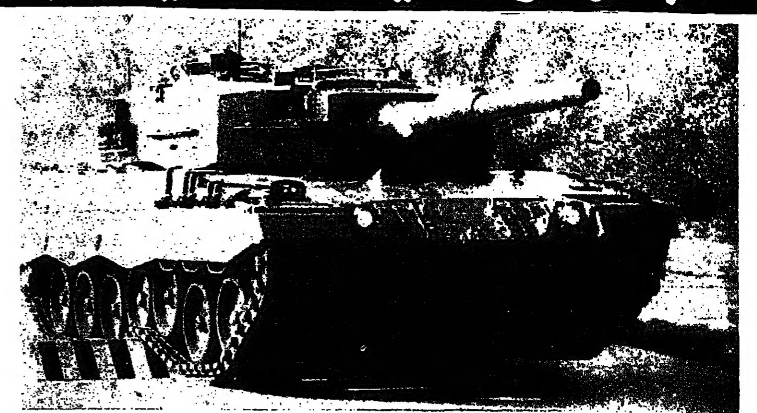
مبلة طيور، الألمانية